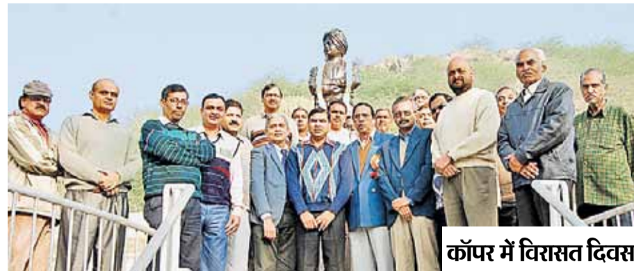
खेतड़ी नगर, विरासत दिवस पर स्वामी विवेकानंद को श्रद्धांजलि देने आए अधिकारी।