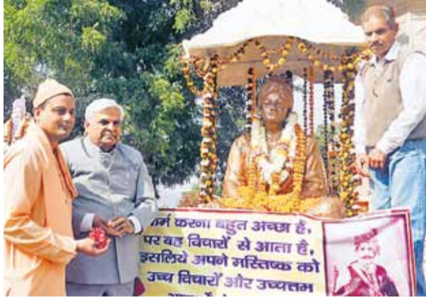
खेतड़ी, स्वामी विवेकानंद की प्रतिमा पर पुष्प अर्पित करते ऊर्जा मंत्री एवं मिशन के सचिव।