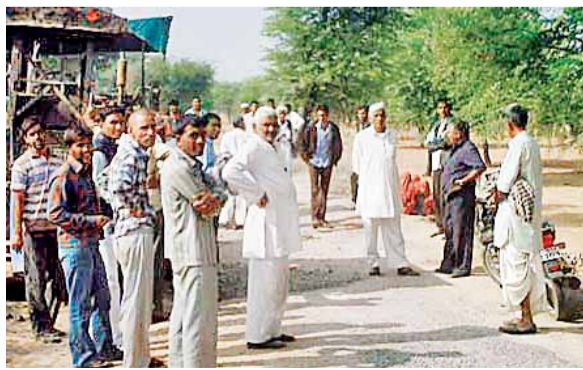
खिरोड़, तारपुर मार्ग पर सड़क निर्माण को रुकवाते ग्रामीण व बनाई जा रही घंटिया सड़क।