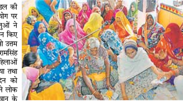
गोपीनाथजी मंदिर में कीर्तन करती महिलाएं