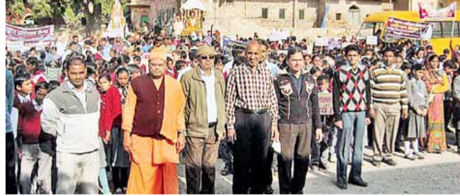
खेतड़ी, प्रभाती फेरी के दौरान मिशन के सामने एकत्रित छात्र व श्रद्धालु।