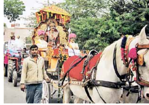
स्वामी विवेकानंद को लाते राजा अजीत सिंह की बगगी की झांकी।